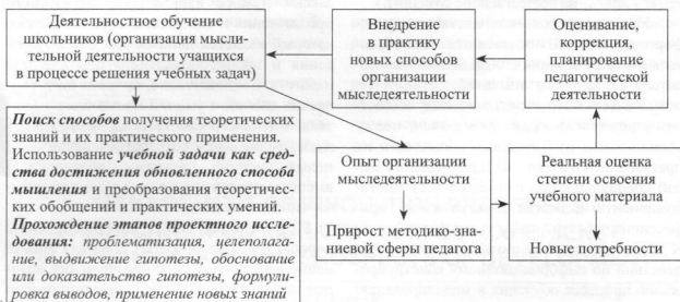
Рис. 1. Опыт по организации деятельностного обучения школьников как основа самообразования учителя

ний, а также прохождения с детьми этапов проектного исследования: проблематизацию, целеполагание, выдвижение гипотезы, обоснование или доказательство гипотезы, формулировку вывода, применение новых знаний, – учитель получает опыт организации мыследеятельности. Эти же способы работы он трансформирует в деятельность по организации процесса своего обучения. При этом происходит прирост методико-знаниевой сферы педагога. После выхода в рефлексивное пространство, учитель способен дать реальную оценку степени освоения им учебного материала, а следовательно, у него появляются новые образовательные потребности. Пройдя через оценивание, коррекцию и планирование образовательной деятельности, педагог способен внедрить в свою практику новые приемы организации мыследеятельности учащихся. Таким образом учитель получает опыт как основной продукт, который может быть использован им и его коллегами, а также приобретает новые личностные качества, трансформируемые в компетентности.